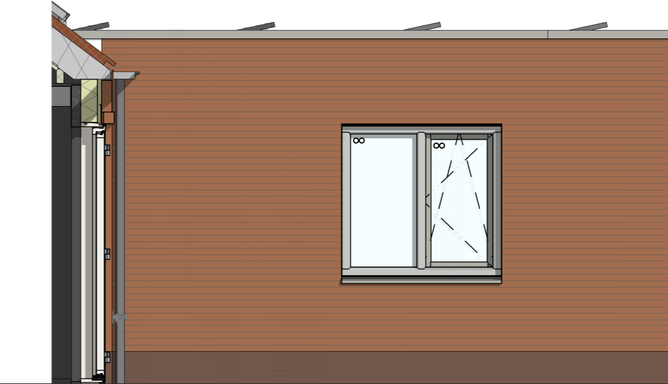
zijgevel zijaanbouw 1 : 50