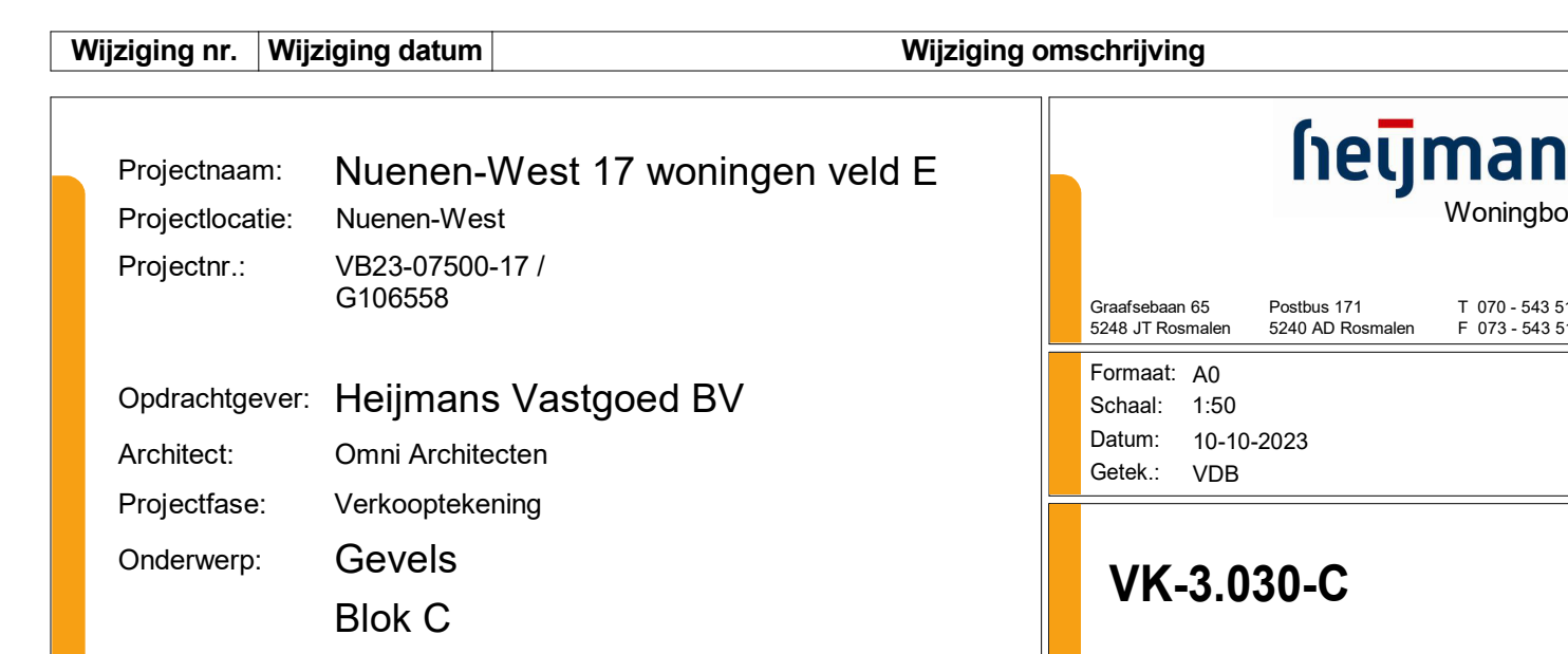
linkerzijgevel 1 : 50